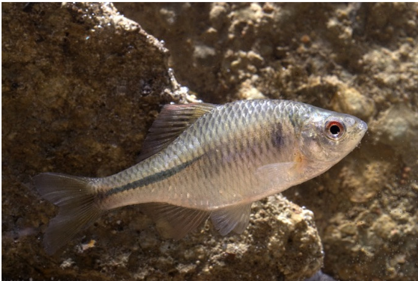
Bouvière Rhodeus amarus (1134)