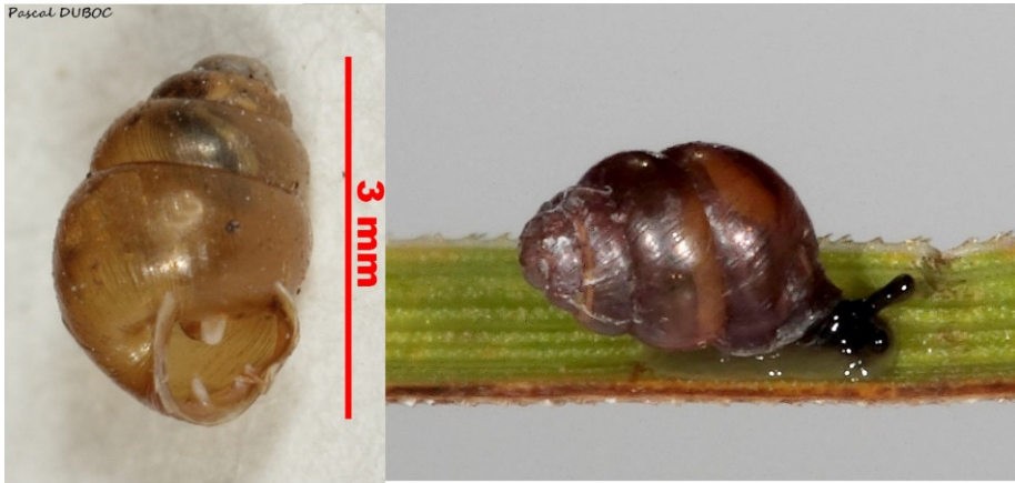
Vertigo de Desmoulins Vertigo moulinsiana (1016)