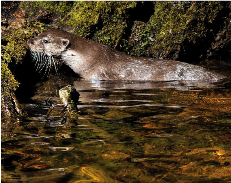
Loutre d'Europe Lutra lutra (1355)