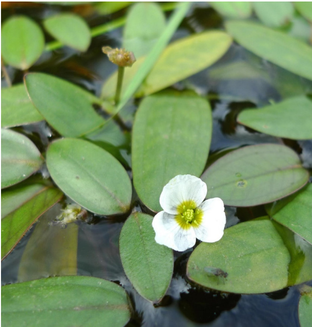
Flûteau nageant Luronium natans (1831)